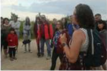
La nuit sur l'écrouves, les visiteurs se sont réunis au plateau d'Ecrouves pour une visite nocturne sensorielle, sur les pas de la nuit de l'écrouves. Une action de sensibilisation lancée par la communauté de communes Terres Toulaises.

Mémoires, parfums évanescents, les chauves-souris connaissent un fort déclin. Une vingtaine de participants sont partis à leur rencontre lors d'une visite nocturne sensorielle sur le plateau d'Ecrouves. Une action de sensibilisation lancée par la communauté de communes Terres Toulaises.