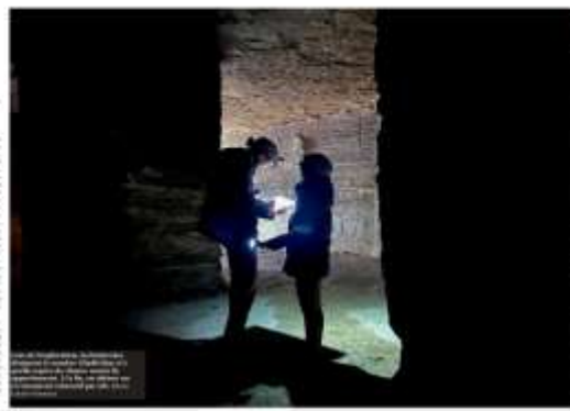
« Les chauves-souris cherchent la quiétude »

La CPEPESC (Commissariat Départemental de la Protection des Espèces Sauvages et des Animaux Sauvages) agit depuis quarante ans pour la préservation des chauves-souris en Lorraine. Elle organise des opérations de recensement, des actions de sensibilisation et des programmes de protection des colonies.